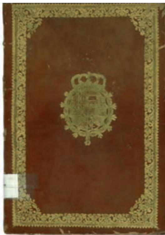
Fig. 1.- Volumen conteniendo los Estatutos de la Real Academia de Bellas Artes de San Carlos con la firma del rey Carlos III. Archivo de la Real Academia de Bellas Artes de San Carlos, sig. 77.

El haberse formado Vergara en la academia particular que había organizado años atrás, también en estudio propio, su maestro Evaristo Muños y contar éste a la sazón con la protección del capitán general Don Luis Reggio y Branceforti Saladeno y Colona, príncipe de