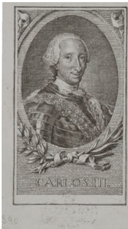
Fig. 2.- Retrato de Carlos III. Anónimo. Grabado calcográfico. 137 x 105 mm. Colección Real Academia de Bellas Artes de San Carlos.

Puesta la vista en la Academia recién instituida en Madrid, la citada junta, constituida por personas independientes de reconocido relieve social, resolvió, a ejemplo de la de San Fernando, crear “Académicos de número, eligiendo entre los Profesores lo mejor de lo mejor, con el fin de que, aspirando los demás al honroso distintivo de Académicos, y a los que la piedad del Rey fuese servido concederles, como se pide a S. M., continúen con la mayor constancia sus tareas”. 4