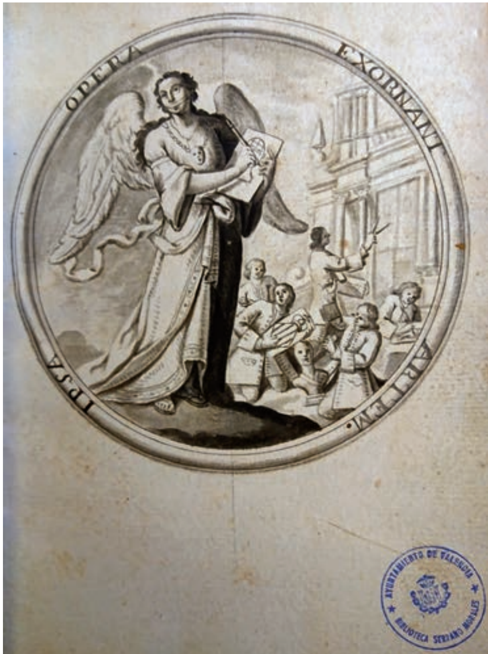
Fig. 3.- Alegoría de las Bellas Artes que figura en el manuscrito intitulado: “Representación hecha a la Muy Noble y Leal Ciudad de Valencia por los Directores y Conciliarios que dirigen la Academia de Santa Bárbara establecida en la Universidad de Valencia en el presente año de 1754”. Biblioteca Serrano Morales del Ayuntamiento de Valencia, sig. A-25/140(1).